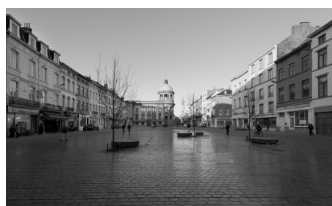
Place Communale Molenbeek